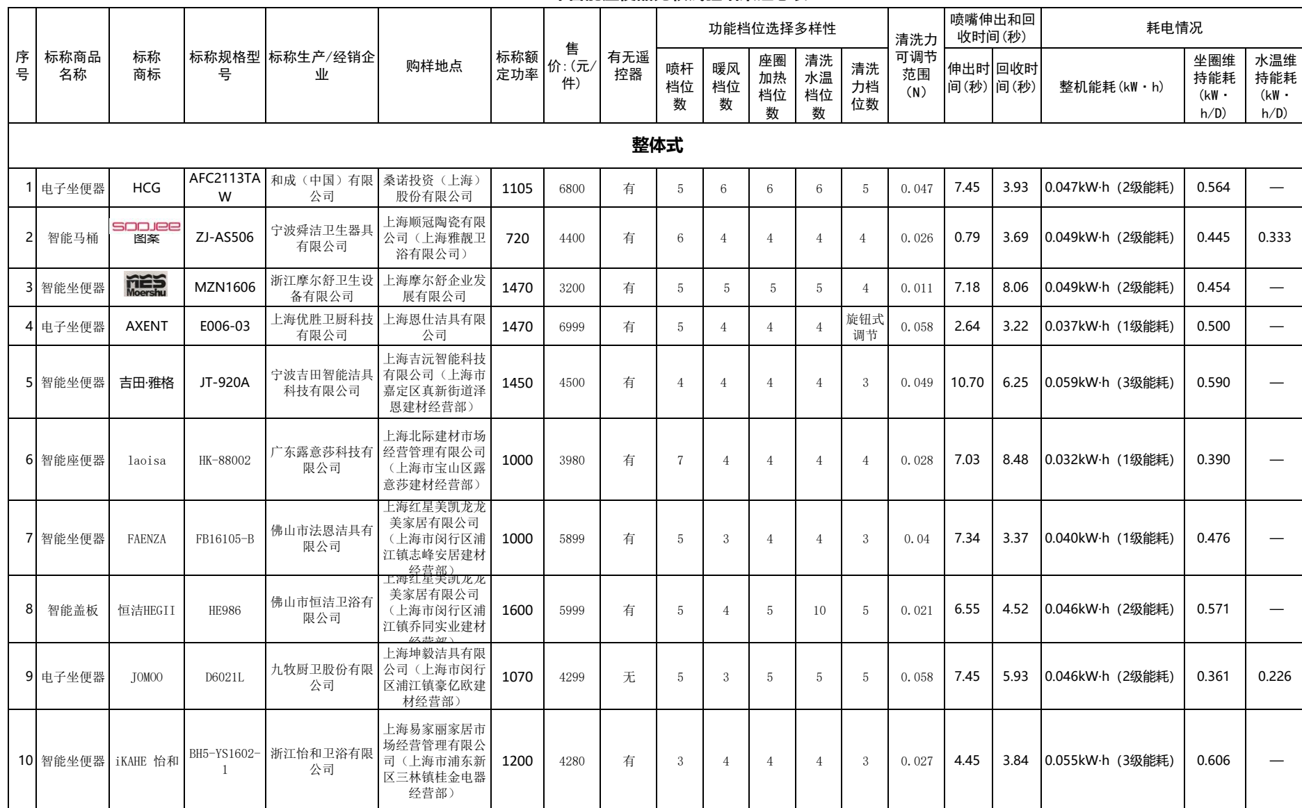
2018年智能座便器比较试验结果汇总表